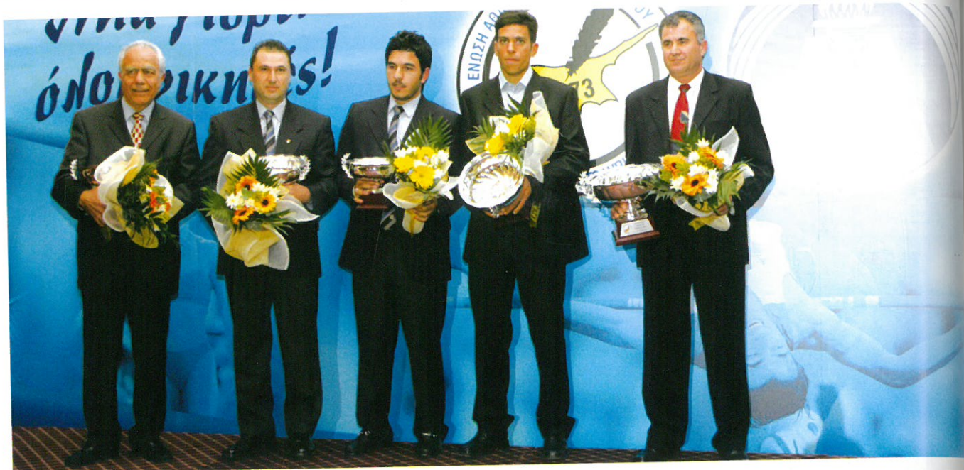
Ομαδική φωτογραφία των κορυφαίων αθλητών του 2005.