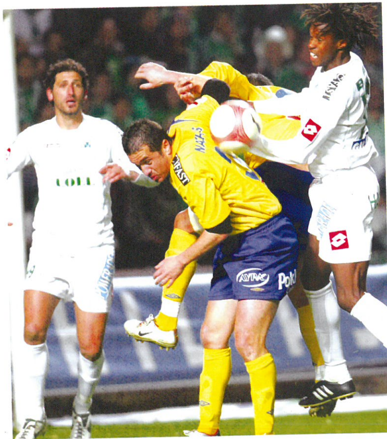
Η άμυνα της Ομόνοιας ήταν η πλέον αποτελεσματική του περσινού πρωταθλήματος.