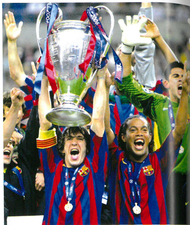
Ποιοι θα διαδεχθούν τους Κάρλες Πουγιόλ και Ροναλντίνιο στο θώκο της Ευρώπης; Θα το μάθουμε το βράδι της 23ης Μαΐου, στο ΟΑΚΑ.