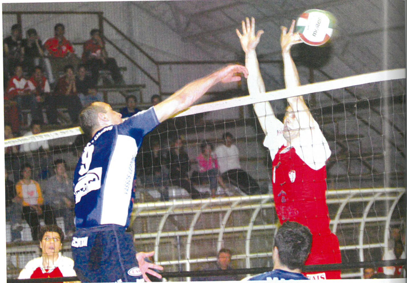
Το «καρφί» ήταν μια από τις ειδικότητες του Χρύση.