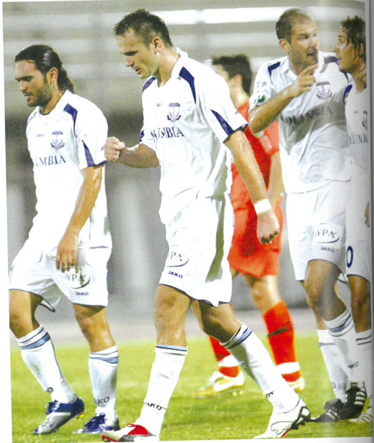
Ένα από τα πολλά πανηγύρια του Απόλλωνα στην περσινή περίοδο.