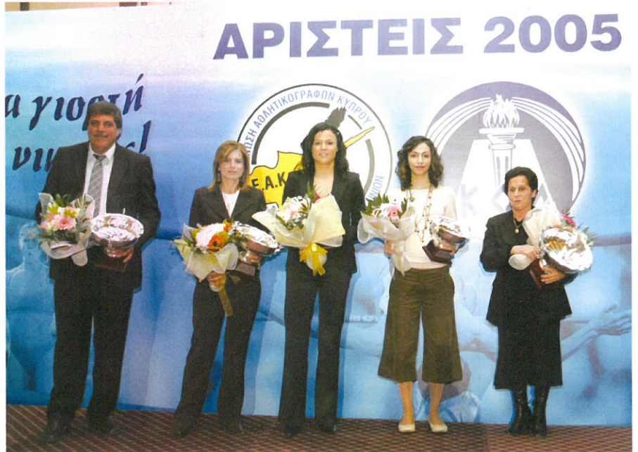
Αναμνηστική φωτογραφία μετά την απονομή των επάθλων στις κορυφαίες αθλήτριες του 2005.