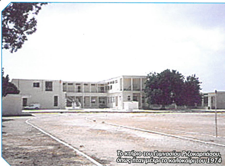
Το κτήριο του Γυμνασίου Ριζοκάρπασου, όπως ήταν μέχρι το καλοκαίρι του 1974

Η παιδεία και η θρησκεία διαδραμάτισαν ουσιαστικό ρόλο στη διατήρηση της εθνικής και πολιτιστικής ταυτότητας του κυπριακού λαού σε καιρούς δύσκολους. Με τα πενιχρά μέσα που διέθεταν οι διάφορες κοινότητες του νησιού έθεταν σε λειτουργία υποτυπώδη δημοτικά σχολεία, σε πόλεις δε και σε κωμοπόλεις ιδρύονταν γυμνάσια και λύκεια για την ανώτερη μόρφωση των νέων. Εξαιρέση από την πρακτική αυτή δεν μπορούσε να αποτελέσει η κωμόπολη του Ριζοκάρπασου, το Γυμνάσιο του οποίου συμπλήρωσε ένα αιώνα ζωής το 2017. Η ΕΑΚ, αναγνωρίζοντας την προσφορά του Γυμνασίου, τόσο προ της τουρκικής εισβολής περίοδο όσο και μετά (και ειδικότερα μετά το 1974) αποφάσισε να απονέμει σε αυτό, το Αριστείο 2017.