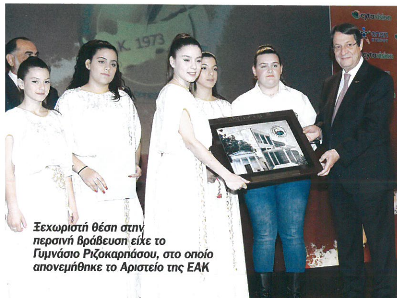
Ξεχωριστή θέση στην περσινή βράβευση είχε το Γυμνάσιο Ριζοκαρπάσου, στο οποίο απονεμήθηκε το Αριστείο της ΕΑΚ