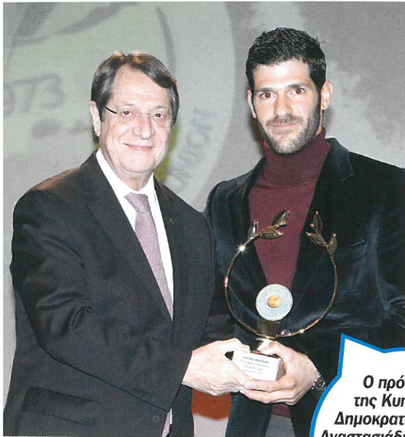
Ο πρόεδρος της Κυπριακής Δημοκρατίας, Νίκος Αναστασιάδης, ανέμεινε πέρσι το έπαθλο στον Παύλο Κοντίδη, κορυφαίος αθλητής