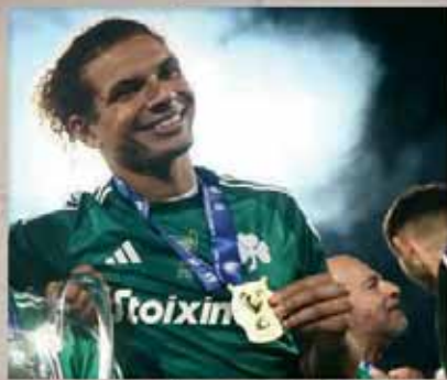
Τελικός Κυπέλλου Ελλάδος 2024