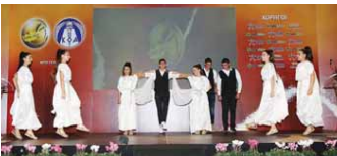
Στη Γιορτή Αρίστων που έγινε στις 9 Ιανουαρίου 2018, το Αριστείο της ΕΑΚ απονεμήθηκε στο Γυμνάσιο Ριζοκάρπασου. Στη φωτογραφία, μαθήτρες και μαθήτριες του σχολείου μας χαρίζουν ένα χορευτικό, στη διάρκεια της τελετής.