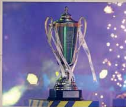
Πρωτάθλημα Κύπρου 2024