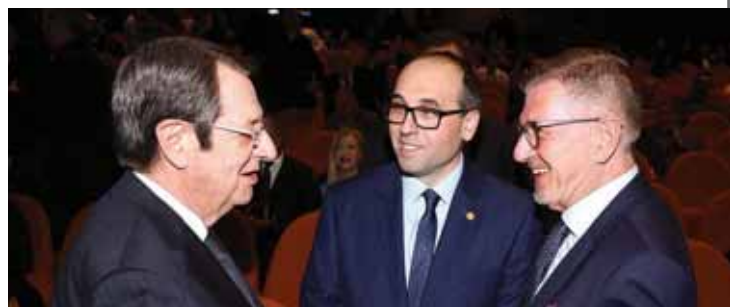
Ο Πρόεδρος της Κυπριακής Δημοκρατίας, Νίκος Αναστασιάδης, με τον πρόεδρο της AIPS Europe, Τσαρλς Καμεζούλι και τον πρόεδρο της ΕΑΚ, Ηρόδοτο Μιλιτιάδου, στη Γιορτή Αρίστων στις 12 Ιανουαρίου 2023 στο Δημοτικό Θέατρο Λευκωσίας.