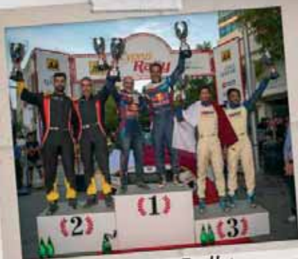
Cyprus Rally 2024

35 ΚΑΙ ΠΛΕΟΝ ΧΡΟΝΙΑ ΠΑΡΩΝ ΣΕ ΟΛΕΣ ΤΙΣ ΜΕΓΑΛΕΣ ΑΘΛΗΤΙΚΕΣ ΣΤΙΓΜΕΣ ΤΟΥ ΤΟΠΟΥ ΜΑΣ