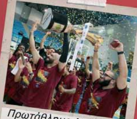
Πρωτάθλημα Μπάσκετ 2024

35 ΚΑΙ ΠΛΕΟΝ ΧΡΟΝΙΑ ΠΑΡΩΝ ΣΕ ΟΛΕΣ ΤΙΣ ΜΕΓΑΛΕΣ ΑΘΛΗΤΙΚΕΣ ΣΤΙΓΜΕΣ ΤΟΥ ΤΟΠΟΥ ΜΑΣ