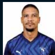
Ζάιρο (Πάφος FC)