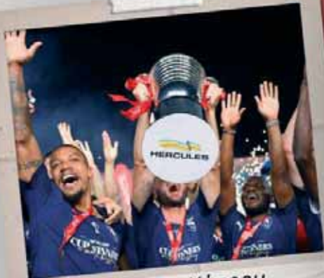
Κύπελλο Κύπρου "Coca-Cola"