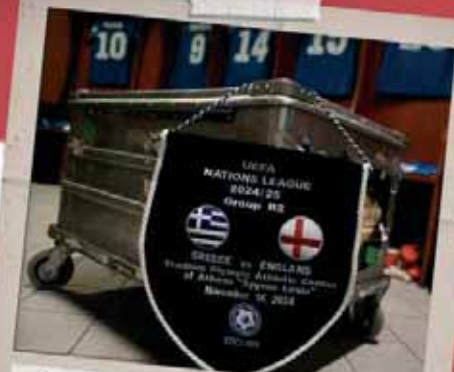
Σχεδιασμός & Παραγωγή Λαβάρων Εθνικής Ελλάδος