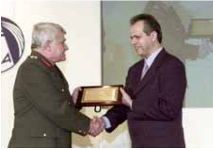
Ο πρόεδρος της ΕΑΚ, Παναγιώτης Φελλούκας, απονέμει τιμητική πλακέτα στον Αρχηγό της Εθνικής Φρουράς, υποστράτηγο Ευάγγελο Φλωράκη, στη Γιορτή Αρίστων του 2000. Τον Ιούλιο του 2002 ο Ε. Φλωράκης έχασε τη ζωή του, σε δυστύχημα εν ώρα υπηρεσίας.