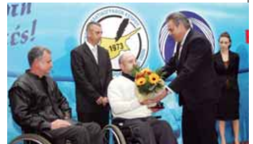
Η ανάδειξη του παρά-αθλητισμού αποτελείούσε πάντοτε βασικό στοιχείο στις Γιορτές των Αρίστων της ΕΑΚ.